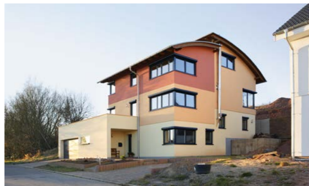
Wohnfläche: 265 m 2 | Bauzeit: 6 Monate

Dach und Wand: AGEPAN® OSB 3 PUR in 15 mm