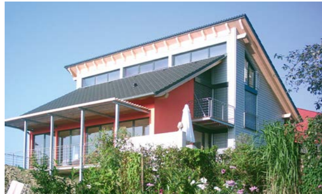
Wohnfläche: 150 m 2 | Bauzeit: 12 Wochen