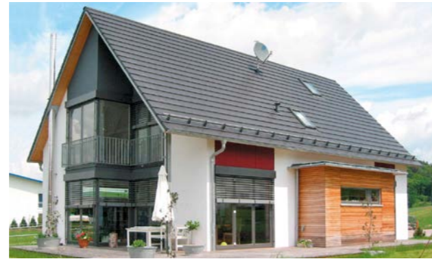
Wohnfläche: 167 m 2 | Bauzeit: 10 Wochen